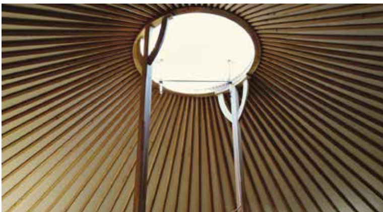
Tündök és istenfák