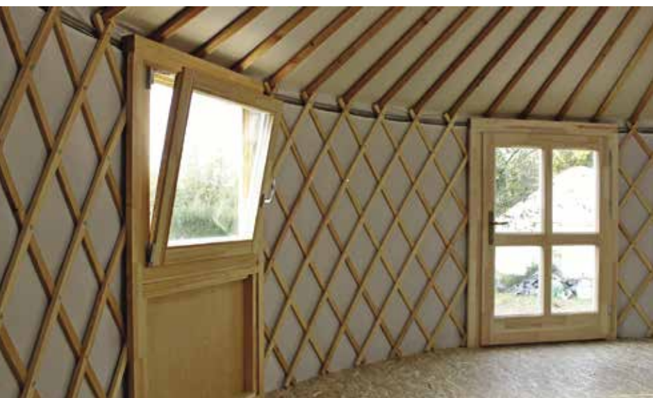
Korszerű nyílászárók a jurtán

Az időtállóság és az esztétikum mellett figyelembe vettünk olyan természetes igényeket is, mint a világos belső tér, vagy épp a karbantartási igény minimalizálása. Ma már magától értetődő követelménynek tekinthető egy modern jurtában a plexibúrával fedett tündök, mint állandó felülvilágító, mely az időjárási viszonyoktól