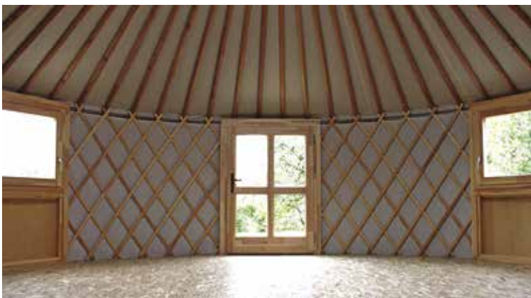
Az alsó és felső világ összefonódása