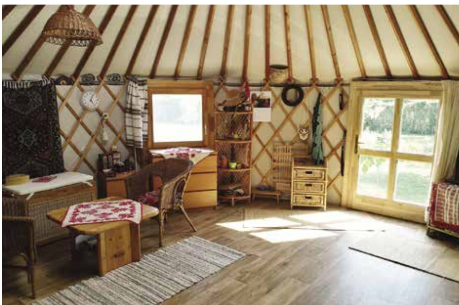
Jurta belső berendezése

függetlenül gondoskodik a belső tér természetes megvilágításáról télen-nyáron. Hasonlóan érthető az az igény is, hogy a jurta ne feladat legyen a használójának, hanem szolgálja, kiszolgálja őt hosszú távon és megbízhatóan.