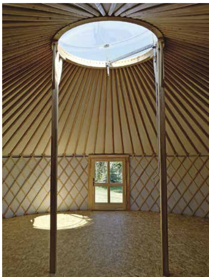
A felső világ: a tündök és a tetőrudak